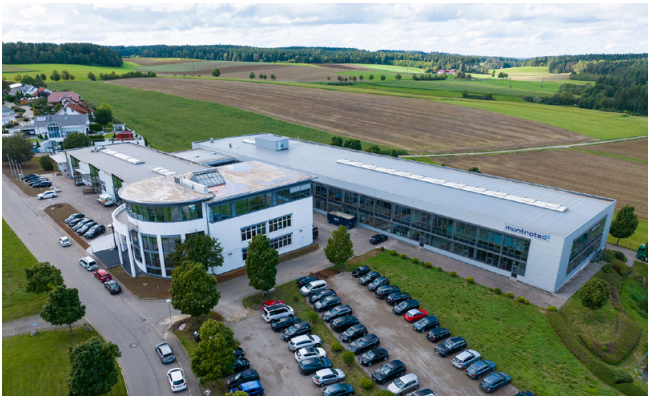
Der Unternehmenssitz der montratec GmbH in Dauchingen (Deutschland).